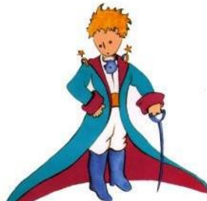
Aquí tienen el mejor retrato que más tarde logré hacer de él.

Me puse en pie de un salto como herido por el rayo. Me froté los ojos. Miré a mi alrededor. Vi a un extraordinario muchachito que me miraba gravemente. Ahí tienen el mejor retrato que más tarde logré hacer de él, aunque mi dibujo, ciertamente es menos encantador que el modelo. Pero no es mía la culpa. Las personas mayores me desanimaron de mi carrera de pintor a la edad de seis años y no había aprendido a dibujar otra cosa que boas cerradas y boas abiertas.